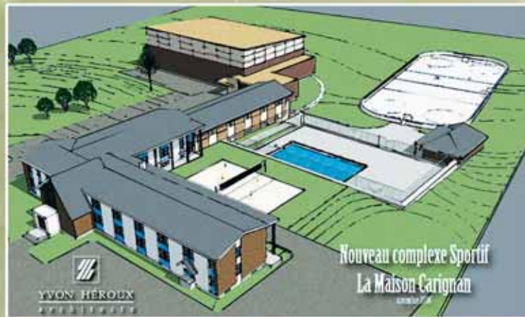
Nouveau complexe Sportif La Maison Carignan

Il croit également qu'il faut aussi donner du lustre au travail de la Maison Carignan. Il faut cesser de voir la toxicomanie, l'alcoolisme et les gens qui en souffrent comme les derniers maillons d'une société. «Ces gens sont des personnes humaines avec des qualités de cœur et s'ils font l'effort de vouloir reprendre leur vie, ils doivent pouvoir le faire dans des endroits invitants dans de bonnes conditions, les meilleures possibles et c'est ce que nous voulons pour eux. Avec les années, nous avons développé un bon programme de thérapie, nous avons un personnel expérimenté, scolarisé qui reste avec nous parce que nous tentons de leur offrir de bonnes conditions de travail, et maintenant nous voulons offrir à nos résidents des aménagements sportifs qui vont dans le sens d'un esprit sain dans un corps sain,» soutient le directeur.