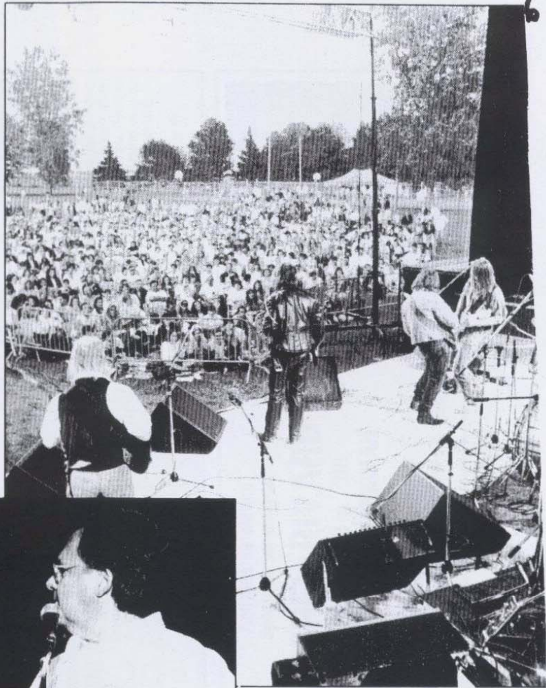
Quelque 3000 personnes ont participé à ce grand rendez-vous estival annuel de la Maison Carignan.

Pour Rivard, il s'agissait de son premier spectacle de l'été. Il s'est dit sensibilisé à la cause sans pour autant prétendre qu'il se bat pour elle à tous les jours. «J'ai passé à travers cette époque où c'était coutume de prendre de la drogue. Mais je connais beaucoup de gens qui sont restés accrochés. Je connais donc la cause», a-t-il mentionné juste avant d'entrer en scène. Le chanteur Daniel Bélanger est par la suite venu l'accompagner.